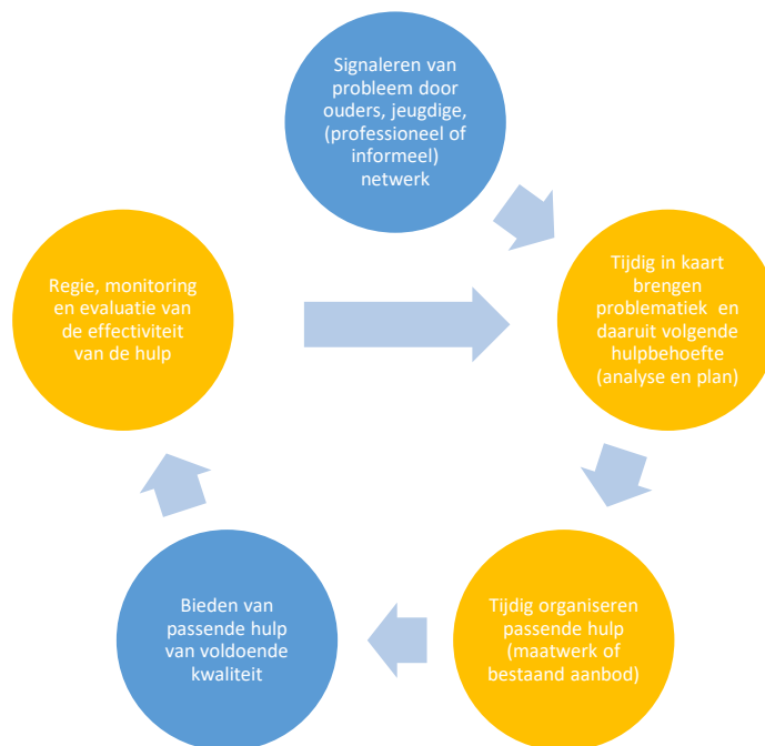
Figuur 1: Elementen van passende hulp

Gesprekken met de bestuurder van Stichting de Toegang, professionals van Stichting de Toegang, ketenpartners en inwoners, een beperkte dossiertoets en aangeleverde schriftelijke informatie vormden de bronnen voor dit toezicht.