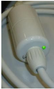
Figuur 1 - Groene LED-indicatie in gebruik

Gedurende onze post-market surveillance hebben we geconstateerd dat de aansluitlijnen mogelijk defect zijn. De storing kan worden waargenomen omdat de verbindingsslijn geen stroom levert en de pomp dus niet oplaadt. Deze fout kan eenvoudig worden opgespoord door de LED-indicatie van de kabel te controleren die aangeeft dat de kabel in gebruik is of niet ( zie figuur 1). Daarnaast toont ook het batterijsymbool in het scherm van de pomp of deze is aangesloten op netvoeding.