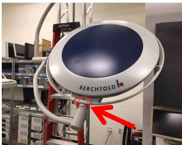
Afbeelding 1: Lamp F 528/F 628 met de bevestigde lampenkap in kwestie

Dit bericht heeft tot doel u ervan op de hoogte te stellen dat Stryker Communications op vrijwillige basis de hierboven genoemde lampenkappen F 528/F 628, die deel uitmaken van het Berchtold Chromophare-operatielampstelsel van Stryker, zal repareren.