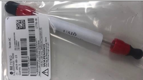
Afbeelding 3 – Dispense Probe

12. Voer de procedure “Replacing the Dispense Probe” (Replace the Dispense Probe) uit, hoofdstuk 13 van de Instructions For Use (IFU) or System Help. of neem contact op met Beckman Coulter voor assistentie.