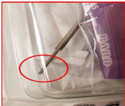
Figure 1: Incorrect Tunneler (6Fr Barb Tip)

Er is met behulp van feedback van de klant vastgesteld dat voor de producten met een combinatie van productcode/lotnummer die in tabel 1 worden vermeld, de kans bestaat dat de verpakking een tunneler met een schroefdraad-tip bevat die is bedoeld om te worden bevestigd aan een katheter van 6 Fr (afbeelding 1) in plaats van de juiste tunneler met aangepaste tip bedoeld voor een katheter van 9,6 Fr (afbeelding 2):