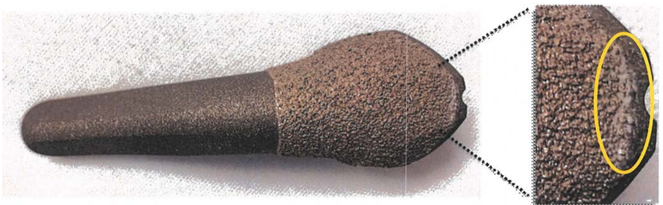
Afb. 2: PETG-restmateriaal op PTC-stelen (deeltjes)

Het restmateriaal verschijnt als een film van dunne, plastic vlokken