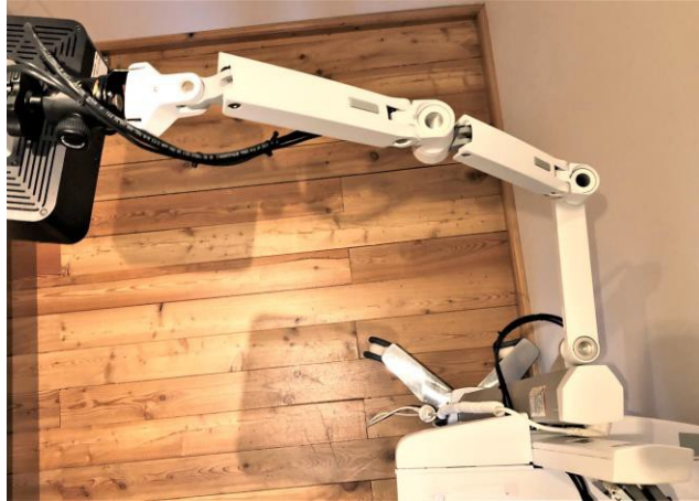
Figuur 2: Vermijd deze ongunstige positionering van de armen, want bij het verstellen van de hoogte van de camera in deze positie werken hoge hendelkrachten op het eerste armelement in.