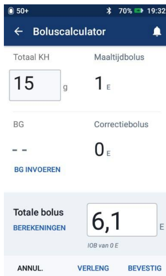
Afbeelding 7: Het scherm geeft een incorrecte hoeveelheid bolus aan.