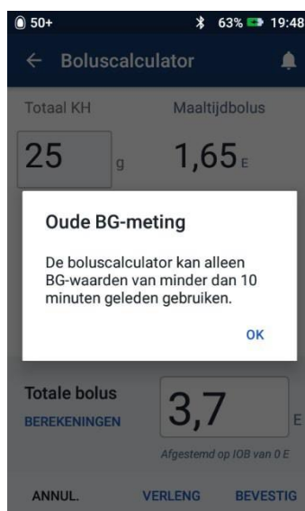
Afbeelding 1: De BG-waarde die is gekoppeld, was meer dan 10 minuten oud en de Omnipod DASH™ PDM staat de gebruiker niet toe om rechtsonder in het scherm van de Boluscalculator 'bevestigen' te selecteren om de bolus toe te dienen.

In de Omnipod DASH™ PDM kan de functie boluscalculator worden gebruikt om een maaltijd- en/of correctiebolus te berekenen. De boluscalculator houdt rekening met de ingevoerde grammen koolhydraten, de huidige bloedglucosewaarde (BG) van de gebruiker en de insuline aan boord (IOB) van de gebruiker om een hoeveelheid bolus voor te stellen. Als de BG-waarde ouder is dan 10 minuten wanneer de gebruiker probeert een bolus te starten, moet de Omnipod DASH™ PDM voorkomen dat deze bolus wordt toegediend (zie afbeelding 1 hieronder).