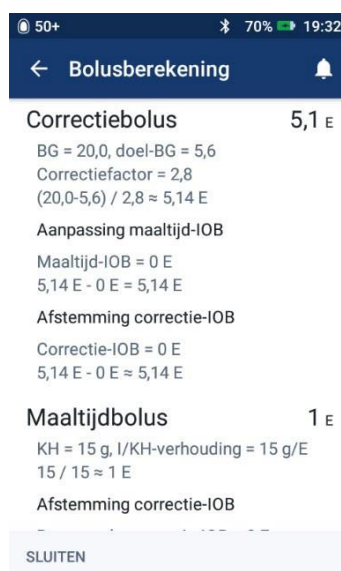
Afbeelding 5: Berekeningen weergegeven incorrekte bolus hoeveelheid gebaseerd op een oude BG meting.

Opmerking: de bovenstaande afbeeldingen zijn alleen ter illustratie. De werkelijke waarden variëren op basis van gebruikersinvoer.