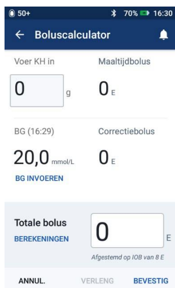
Afbeelding 2: Gebruiker voert de bolus niet toe en drukt annuleren