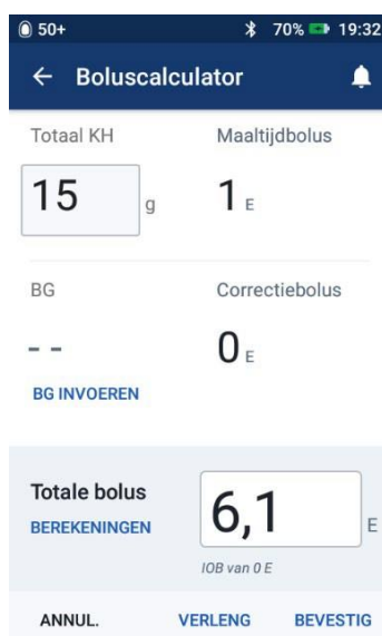
Afbeelding 4: Het scherm geeft een incorrecte hoeveelheid bolus aan.