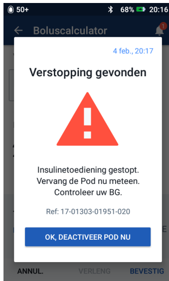
Afbeelding 6: Pod Alarm