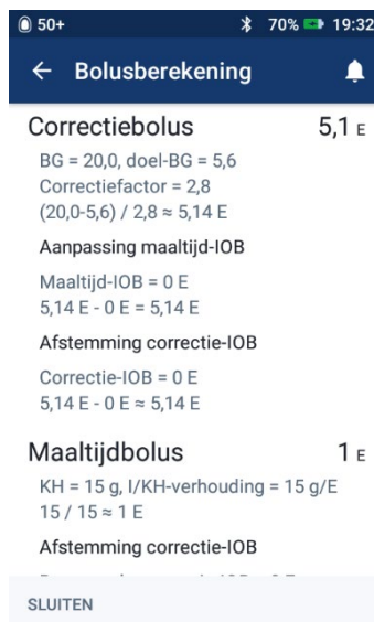
Afbeelding 5: Berekeningen weergegeven incorrecte bolus hoeveelheid gebaseerd op een oude BG meting.

Opmerking: de bovenstaande afbeeldingen zijn alleen ter illustratie. De werkelijke waarden variëren op basis van gebruikersinvoer.