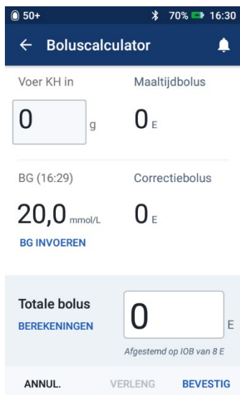
Afbeelding 2: Gebruiker voert de bolus niet toe en drukt annuleren