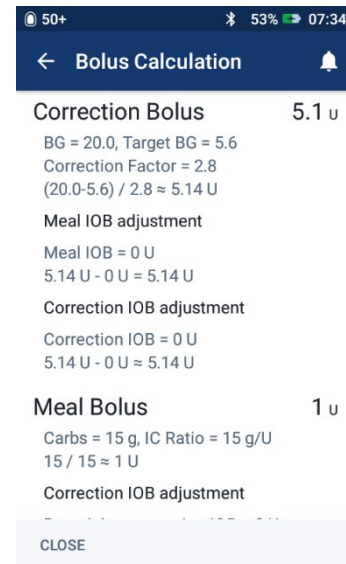
Afbeelding 8: Berekeningen weergeven incorrecte bolus hoeveelheid gebaseerd op een oude BG meting

Opmerking: de bovenstaande afbeeldingen zijn alleen ter illustratie. De werkelijke waarden variëren op basis van gebruikersinvoer.