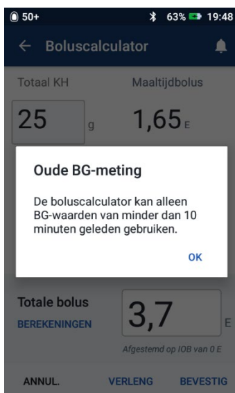
Afbeelding 1: De BG-waarde die is gekoppeld, was meer dan 10 minuten oud en de Omnipod DASH™ PDM staat de gebruiker niet toe om rechtsonder in het scherm van de Boluscalculator 'bevestigen' te selecteren om de bolus toe te dienen.

In de Omnipod DASH™ PDM kan de functie boluscalculator worden gebruikt om een maaltijd- en/of correctiebolus te berekenen. De boluscalculator houdt rekening met de ingevoerde grammen koolhydraten, de huidige bloedglucosewaarde (BG) van de gebruiker en de insuline aan boord (IOB) van de gebruiker om een hoeveelheid bolus voor te stellen. Als de BG-waarde ouder is dan 10 minuten wanneer de gebruiker probeert een bolus te starten, moet de Omnipod DASH™ PDM voorkomen dat deze bolus wordt toegediend (zie afbeelding 1 hieronder).