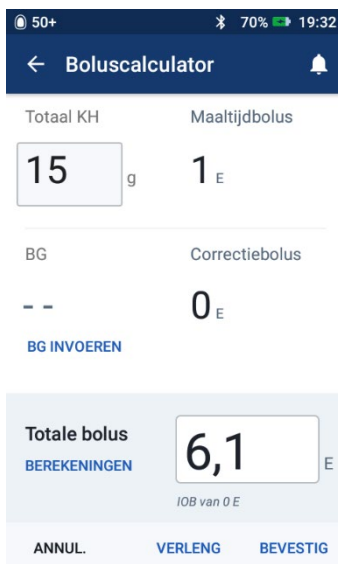
Afbeelding 4: Het scherm geeft een incorrecte hoeveelheid bolus aan.