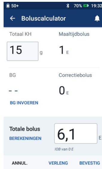
Afbeelding 7: Het scherm geeft een incorrecte hoeveelheid bolus aan.