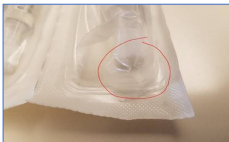
Afbeelding 1: Voorbeeld van plaats van defect

BD heeft door feedback van klanten kennis gekregen dat er in de individuele verpakking van een aantal van de BD PosiFlush™ XS-spuiten van 10 ml (REF: 306572) gaten kunnen zitten, met gevolgen voor de integriteit van de verpakking en de externe steriliteit van de spuit. Naar schatting heeft dit probleem betrekking op minder dan 1 op de 10 vervaardigde hulpmiddelen. Zie afbeelding 1 hieronder voor een voorbeeld van het probleem en de plaats van het defect. Hoewel de steriliteit van het buitenoppervlak van de spuit aangetast kan zijn, blijven de zoutoplossing en het vloeistofpad steriel.