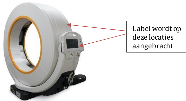
Afbeelding 2 - Afbeelding die de locatie weergeeft waar de labels worden aangebracht.