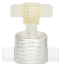
Figuur 1: Voorbeeld van steriele adapter, ref. 000-40F