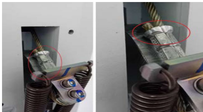
Afbeelding 1. Krimpaansluiting van staalkabel

Philips heeft tot april 2024 geen meldingen ontvangen dat dit probleem zich heeft voorgedaan of schade heeft veroorzaakt.