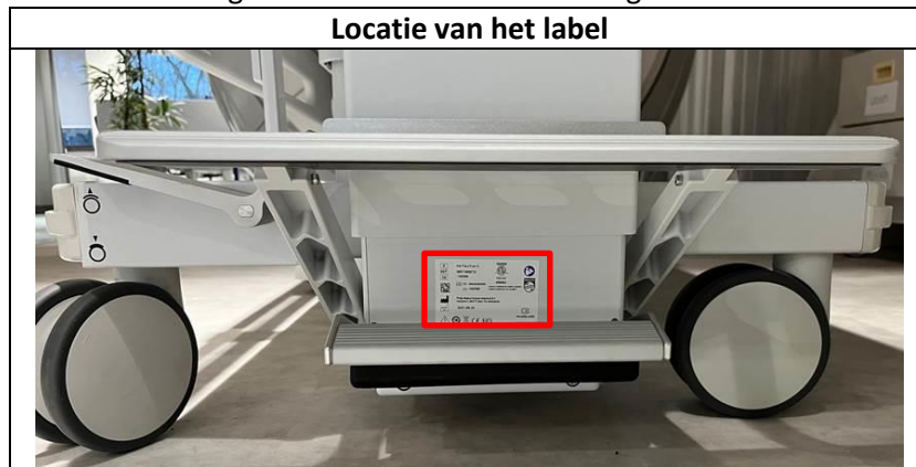
Afbeelding 2. Labellocatie van de in hoogte verstelbare FlexTrak

Het in hoogte verstelbare FlexTrak-identificatielabel bevindt zich aan de handgreepzijde van de trolley onder het pompedaal, zoals weergegeven in afbeelding 2.