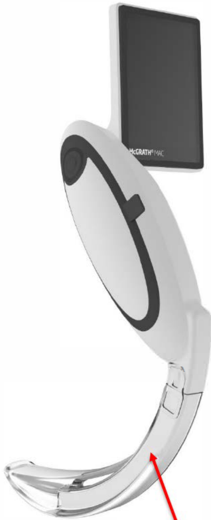
CameraStick™ (één kleur)