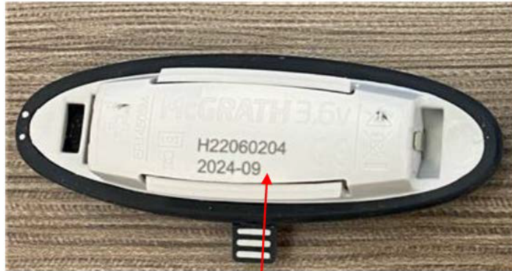
Achterkant van McGRATH 3.6V-batterij - vervaldatum