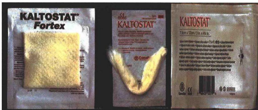
Afbeelding 1 – Primaire verpakking >> Begeleidende afbeelding ter ondersteuning van de identificatie van het betreffende product.

Uit onze gegevens blijkt dat u mogelijk de betreffende eenheden hebt ontvangen. De betreffende eenheden werden tussen 25 juni 2024 en 12 juli 2024 verdeeld naar de betrokken markten.